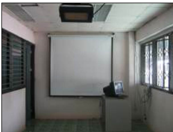
ห้องสื่อโสตฯ ของแต่ละแผนกที่มีไว้ใช้ในการทำการสอน