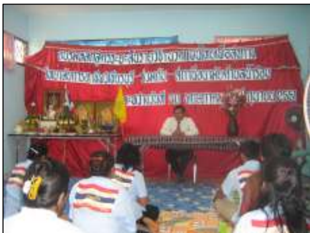
การเปิดสอนหลักสูตรระยะสั้น นวคแผนไทยเพื่อสุขภาพ