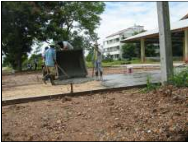
การเทพื้นคอนกรีตหน้าโรงอาหารหลังใหม่