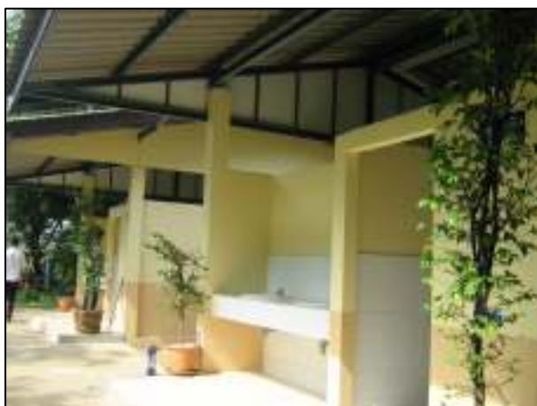
ห้องน้ำข้างโรงอาหารหลังเก่าที่ได้รับการปรับปรุง