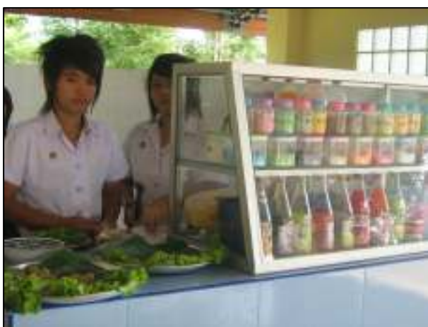
การดำเนินธุรกิจขนาดย่อม ในรายวิชาโครงการวิชาชีพ