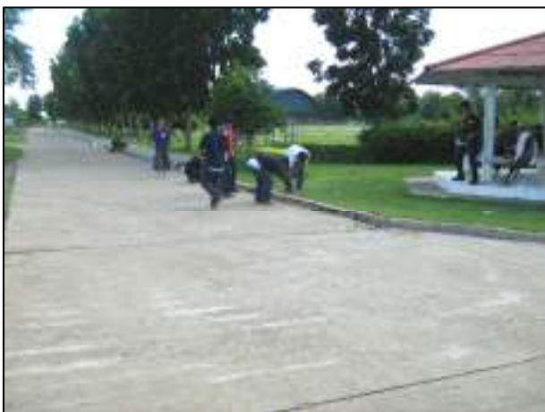
การปรับปรุงขอบถนนภายในวิทยาลัยฯ