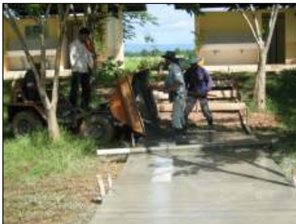
การเทพื้นคอนกรีตทางเข้าห้องน้ำ