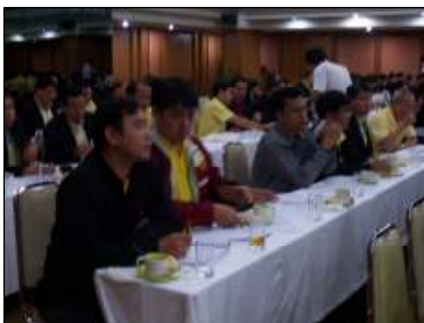
ผู้บริหารและบุคลากร ฝ่ายแผนฯ เข้าร่วมประชุมการจัดทำแผนปฏิบัติราชการ 4 ปี