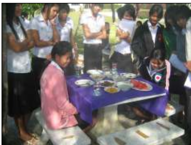
การเรียนรู้นอกจากทฤษฎี โดยการสมมติให้เสมือนจริง