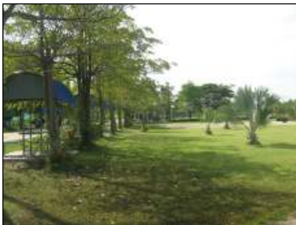
จัดทำชุ่มไว้อำนวยความสะดวกเพื่อการพักผ่อน