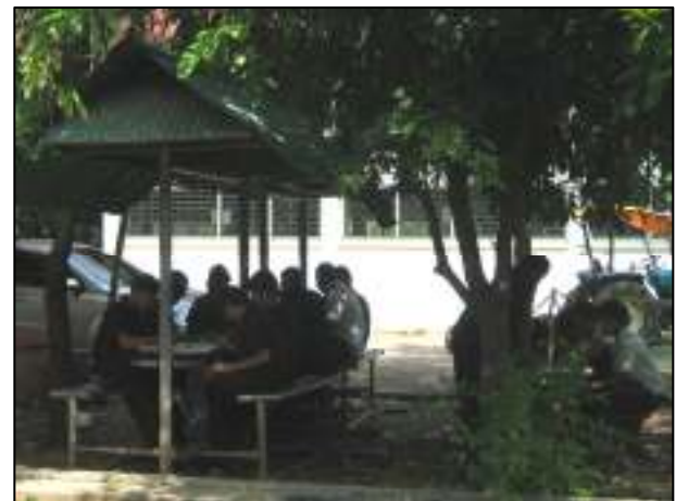
จัดทำชุ่มสำหรับนักเรียน นักศึกษาแผนกเครื่องกล