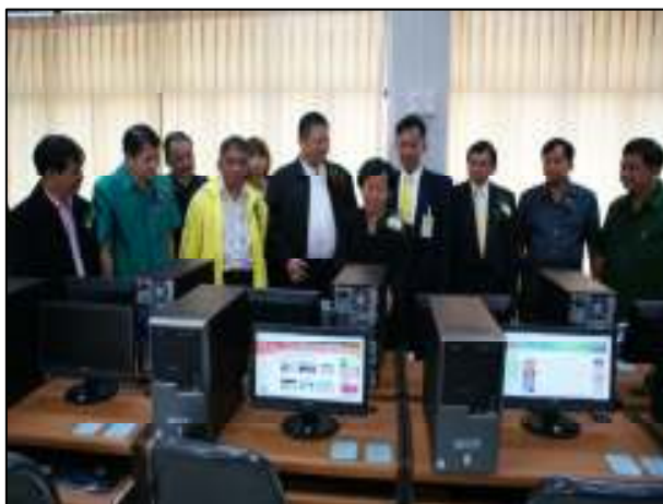
ความพร้อมของห้องเรียนรู้อิเล็กทรอนิกส์ที่ทันสมัย