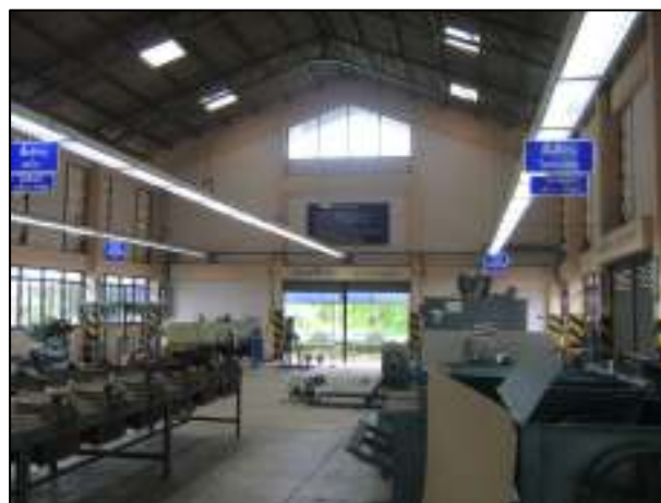
พื้นที่และครุภัณฑ์ที่พร้อมในการจัดเรียนการสอน