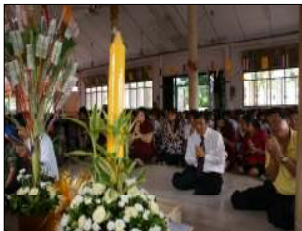
ผู้บริหาร นำคณะครู เจ้าหน้าที่ และนักเรียน นักศึกษา ร่วมทำบุญ และถวายเทียนพรรษา