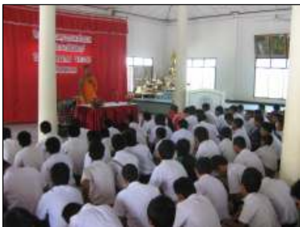
โครงการอบรมคุณธรรม จริยธรรม นักเรียนชั้นปีที่ 1