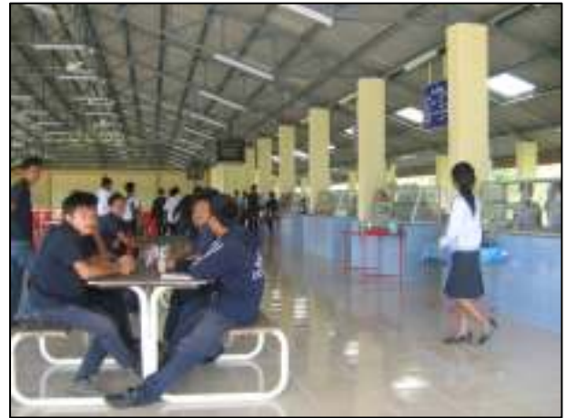
โรงอาหารหลังใหม่ของวิทยาลัยฯ ที่สวยงามและน่าใช้บริการ