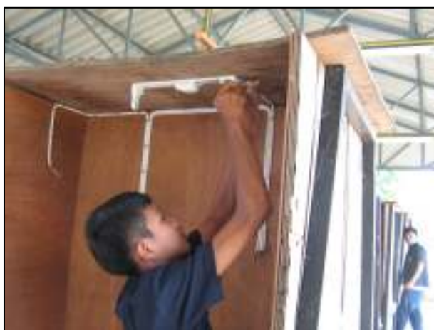
ชุดฝึกสอนของแผนกวิชาช่างไฟฟ้ากำลัง