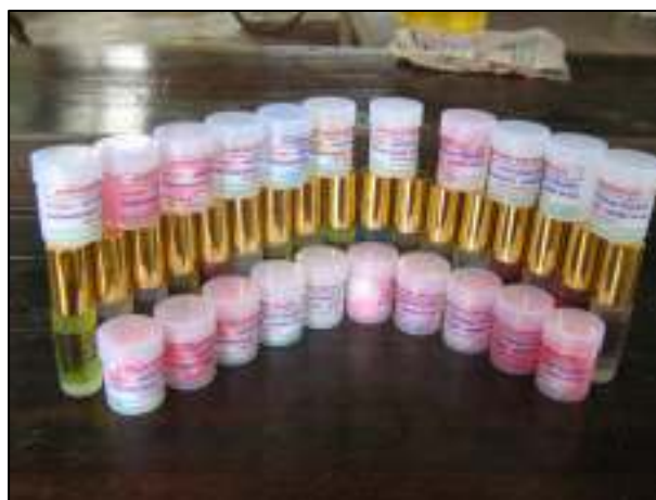
โครงการส่งเสริมการเรียนรู้ตามอัธยาศัย (108 อาชีพ)