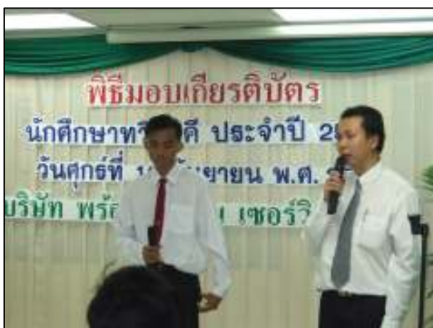
บ.พร้อมเทคโนโลยี เซอร์วิส มอบเกียรติบัตรให้กับนักศึกษา ระบบทวิภาคี ช่างไฟฟ้า รางวัลนักศึกษาตัวอย่าง