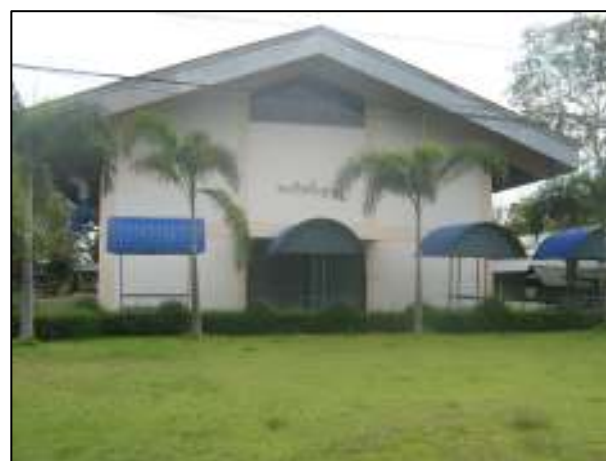
การปรับปรุงภูมิทัศน์หน้าแผนกวิชาเทคนิคพื้นฐาน