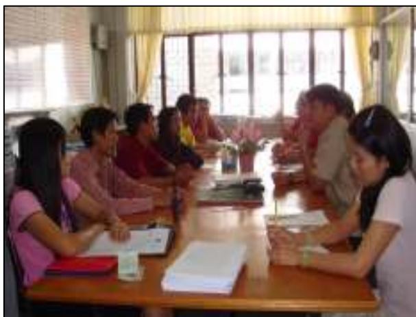
หน่วยงานภายในวิทยาลัยฯ ที่ประชุมปรึกษาหารือเกี่ยวกับการทำงานของงานนั้น ๆ