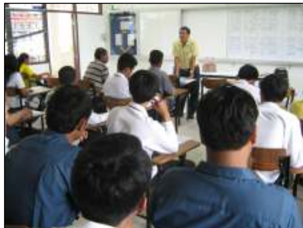
ปฐมนิเทศผู้ปกครอง และนักศึกษาเพื่อเตรียมฝึกประสบการณ์