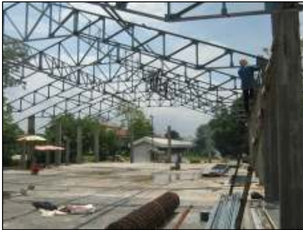
การจัดสร้างโรงอาหารหลังใหม่