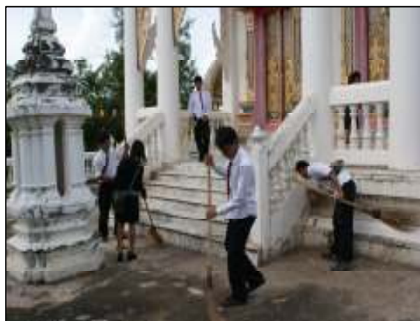
นักเรียน นักศึกษา ร่วมบำเพ็ญประโยชน์ที่วัดอุดมมงคล ตำบลสามแยก อำเภอเวียงเหนือ จังหวัดพิจิตร