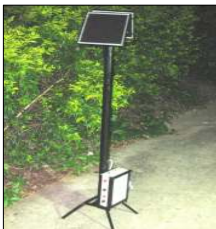
เครื่องกำเนิดกระแสไฟฟ้า ของแผนกวิชาช่างไฟฟ้ากำลัง