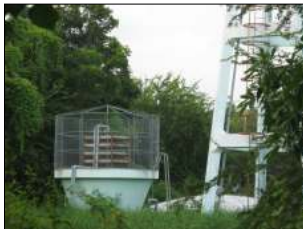
โครงการติดตามข่ายกันนก