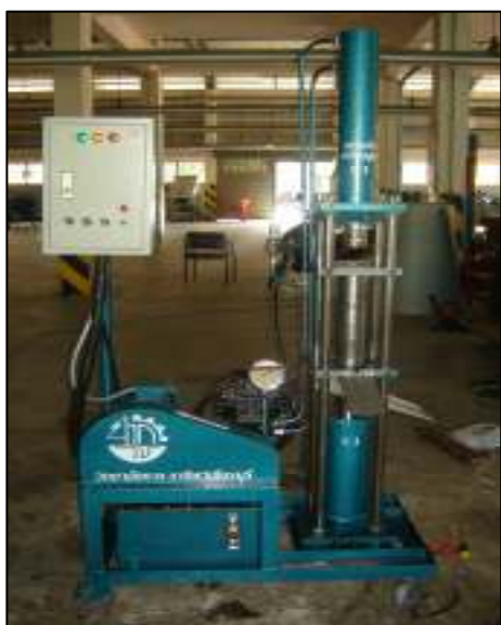
เครื่องหีบเมล็ดสับดำ ของแผนกวิชาเครื่องกล