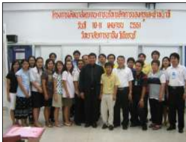
โครงการพัฒนาสมรรถนะการบริหารจัดการของครูและเจ้าหน้าที่