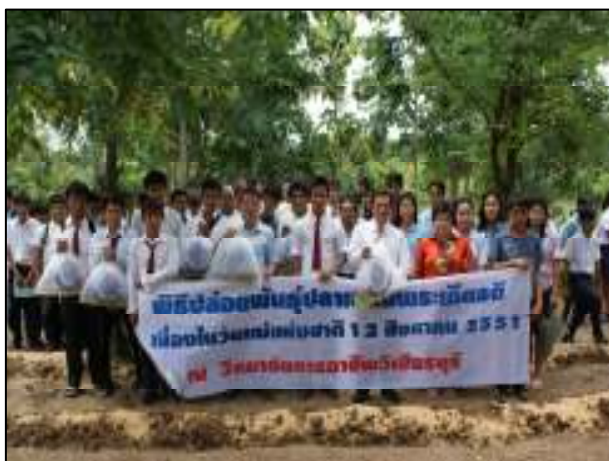
ผู้บริหาร นำคณะครู เจ้าหน้าที่ และนักเรียน นักศึกษา ปล่อยพันธุ์ปลาลงน้ำเฉลิมพระเกียรติเนื่องในวันแม่แห่งชาติ