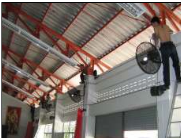
การบูรณาการการจัดการเรียนการสอนที่ปฏิบัติงานจริง