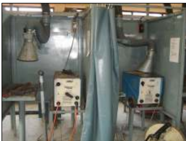
ครูภัณฑ์พร้อมอุปกรณ์แผนกวิชาเทคนิคพื้นฐาน