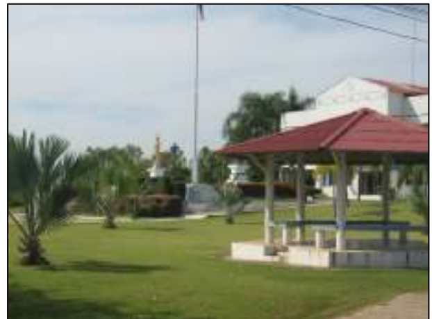
ภูมิทัศน์ทุกมุมของวิทยาลัยฯ ที่แลดูสวยงาม