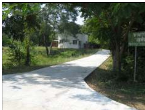
โครงการเทพื้นถนนคอนกรีตภายในวิทยาลัยฯ