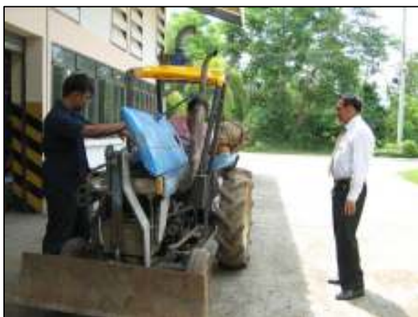
การเรียนรู้เกี่ยวกับเครื่องยนต์ของรถแต่ละประเภท