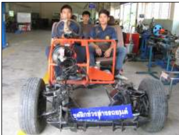
ชุดฝึกสอนของแผนกวิชาเครื่องกล