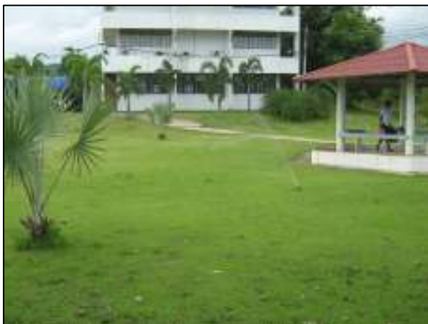
การดูแลรักษา พัฒนาภูมิทัศน์ให้สวยงามอยู่ตลอดเวลา