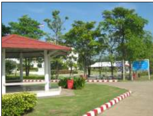
ขอบถนนภายในวิทยาลัยฯ ที่ได้รับการปรับปรุงให้สวยงาม