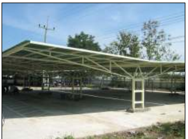
โรงจอดรถนักเรียน นักศึกษา ที่เสร็จสิ้นเป็นที่เรียบร้อย