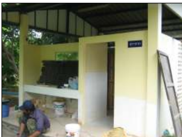
การปรับปรุงห้องน้ำข้างโรงอาหารหลังเก่า