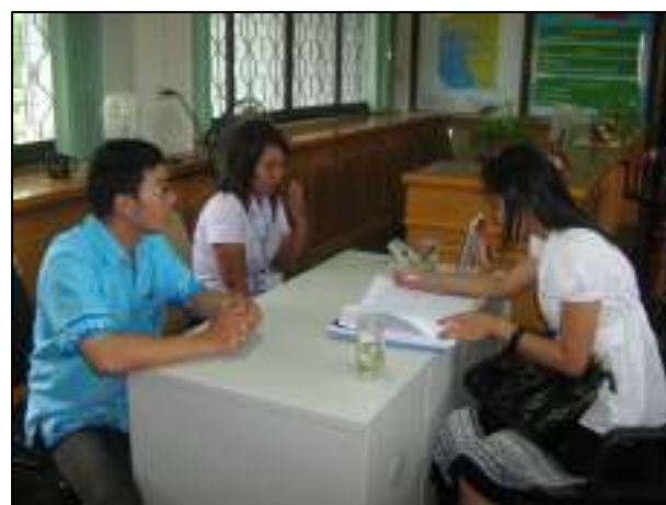
ครูออกนิเทศนักศึกษาฝึกประสบการณ์