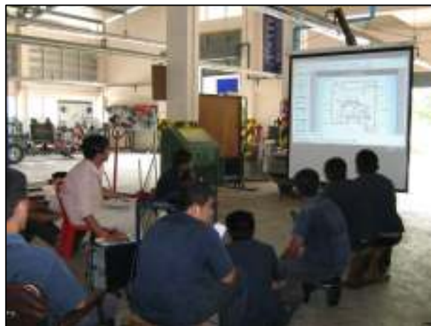
ครูภัณฑ์ที่ทันสมัยในการจัดการเรียนการสอน