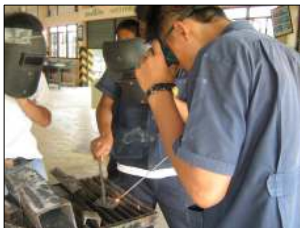
อุปกรณ์ป้องกันความปลอดภัยในการเรียนภาคปฏิบัติ