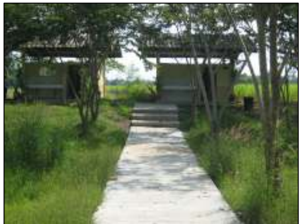
การเทพื้นคอนกรีตทางเข้าห้องน้ำที่เสร็จสิ้นเป็นที่เรียบร้อย