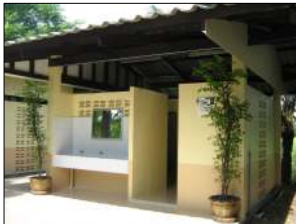
ห้องน้ำแผนกวิชาช่างไฟฟ้ากำลังที่ได้รับการปรับปรุง