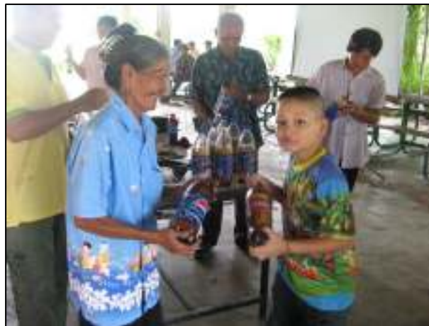
การขับเคลื่อน ปรัชญาเศรษฐกิจพอเพียงในสถานศึกษา ให้ความรู้กับชุมชนในการดำเนินชีวิตตามหลักเศรษฐกิจพอเพียง