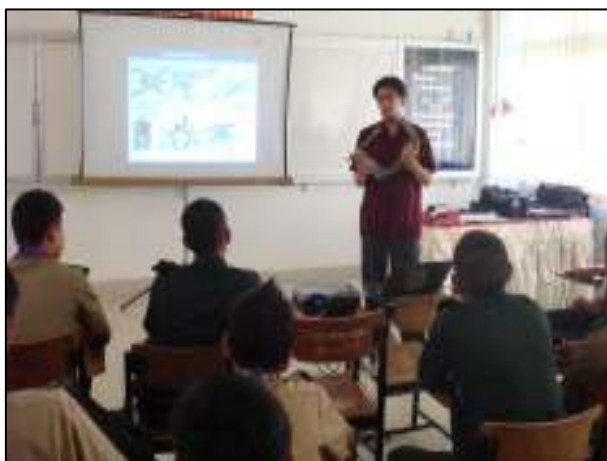
ห้องเรียนที่พร้อมด้วยสื่อในการนำเสนอในการสอน