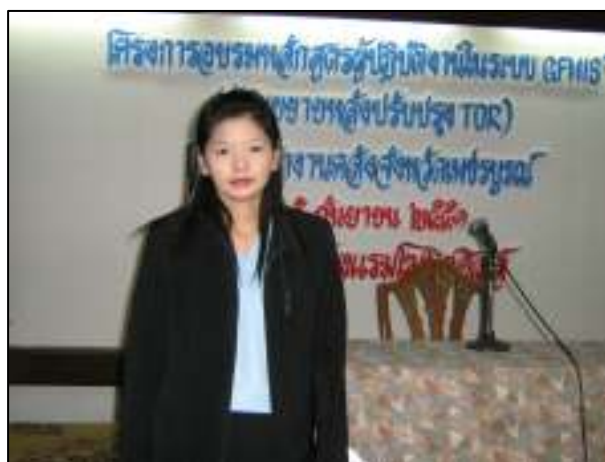
บุคลากรงานการเงิน เข้าร่วมการอบรมหลักสูตรปฏิบัติงานในระบบ GFMIS