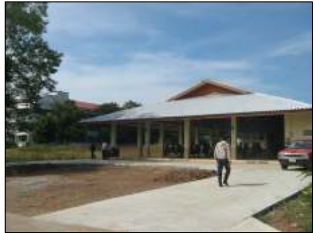
การเทพื้นคอนกรีตที่เสร็จสิ้นเป็นที่เรียบร้อย