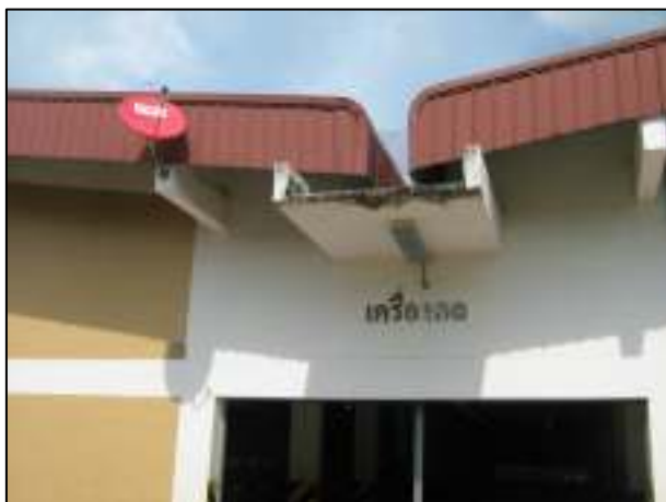
โครงการปรับปรุงระบบเทคโนโลยีสารสนเทศ