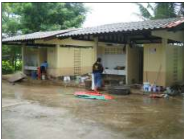
การปรับปรุงห้องน้ำแผนกวิชาช่างไฟฟ้ากำลัง