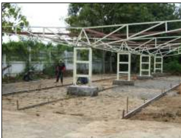
ขั้นตอนการจัดทำโรงจอดรถนักเรียน นักศึกษา