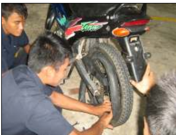
การเรียนรู้ในการซ่อมเกี่ยวกับงานยานยนต์ต่างๆ