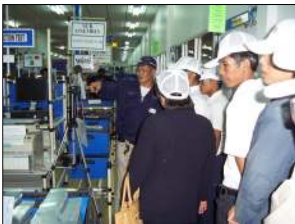
โครงการทัศนศึกษาดูงาน นักศึกษาชั้นปีที่ 1 แผนกวิชาช่างไฟฟ้ากำลัง