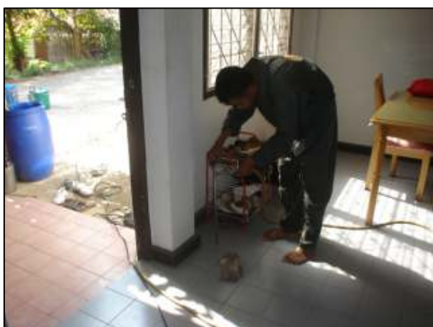
โครงการกำจัดปลวกวิทยาลัยฯ