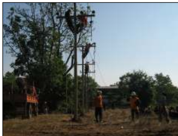
การเรียนรู้ในรายวิชาการติดตั้งไฟฟ้านอกอาคารที่ได้ปฏิบัติงานจริง