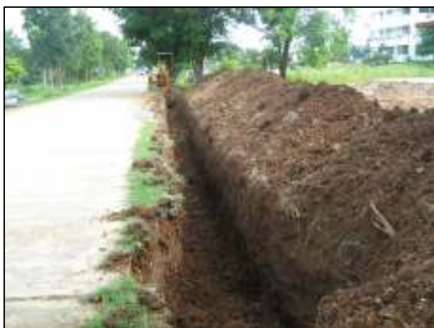
โครงการจัดทำร่องระบายน้ำบริเวณหน้าโรงอาหารใหม่