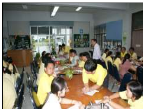
วิทยาลัยฯ จัดประชุมเพื่อปรึกษาหารือร่วมกันพัฒนาและแก้ไขปัญหาต่าง ๆ