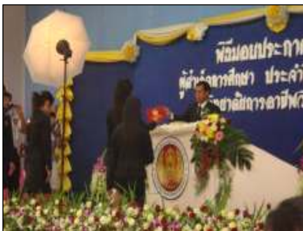
โครงการพิธีมอบประกาศนียบัตร ของวิทยาลัยฯ