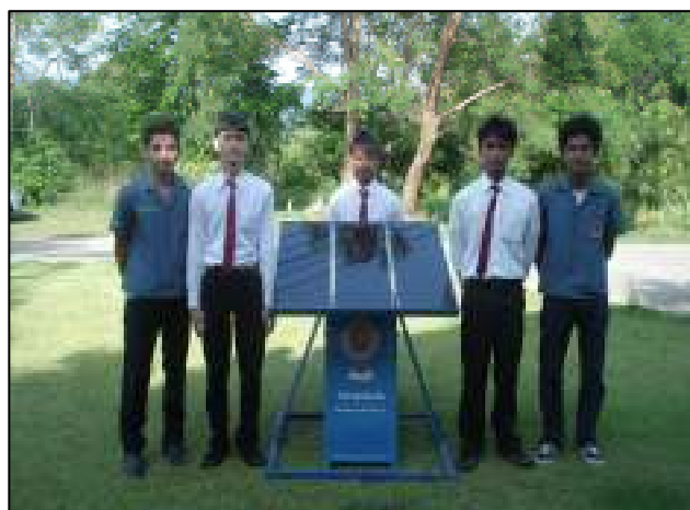
โซล่าเซลล์อัจฉริยะ ของแผนกวิชาเทคนิคพื้นฐาน