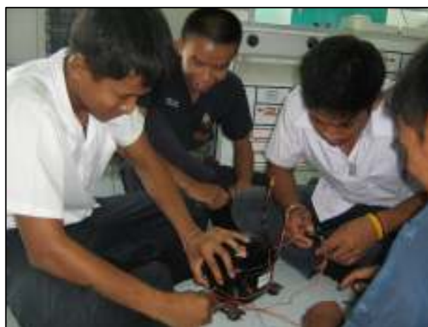
วัสดุอุปกรณ์ที่สามารถปฏิบัติได้เหมือนจริง