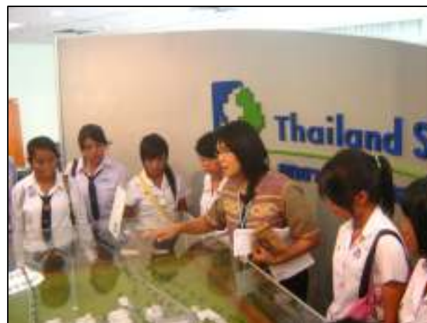
โครงการทัศนศึกษาดูงาน นักศึกษาชั้นปีที่ 1 แผนกพาณิชย์การ