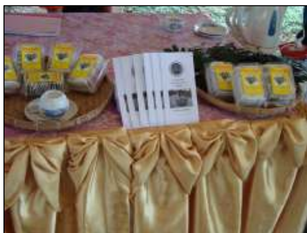
ชาชงสมุนไพร ของแผนกพาณิชยการ