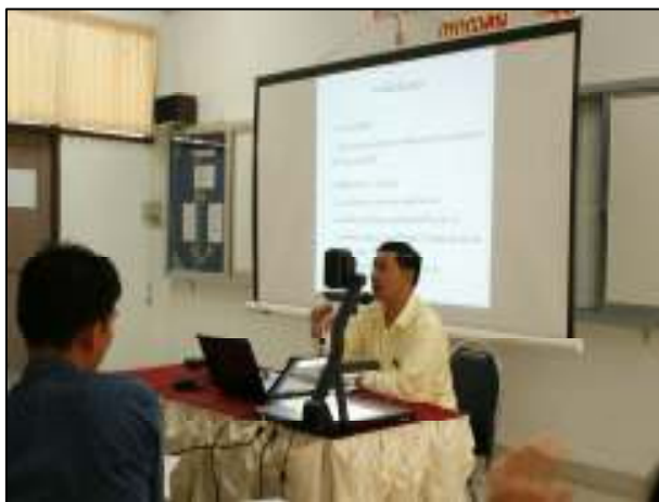
โครงการพัฒนาทักษะการเขียนโครงการ และหนังสือราชการ