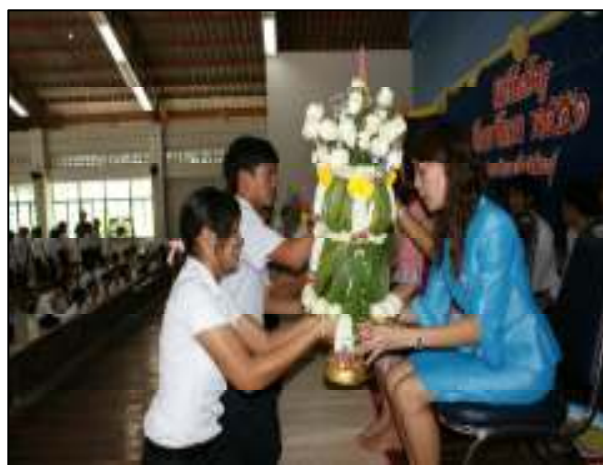
โครงการวันไหว้ครู