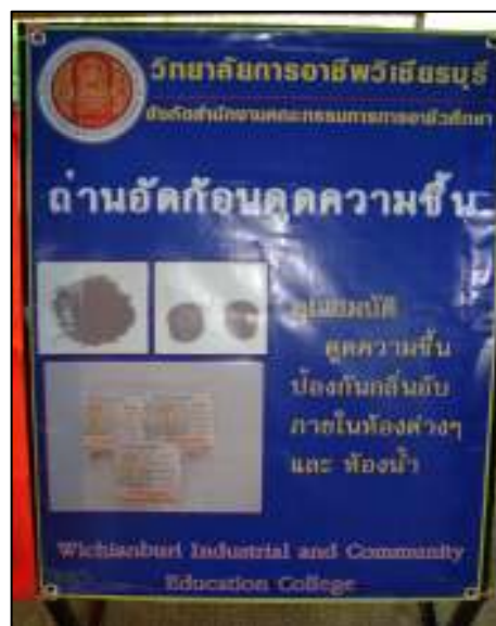
ถ่านอัดก้อนดินความชื้น ของแผนกวิชาสามัญสัมพันธ์