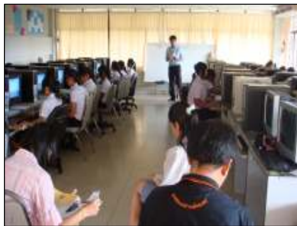
ห้องเรียนรู้ด้วยระบบเทคโนโลยีสารสนเทศ