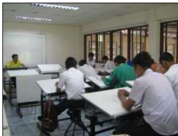
ความพร้อมของห้องเรียน วิชาเขียนแบบเทคนิค